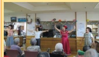
フラダンスの様子