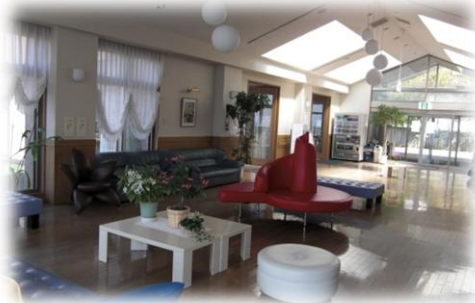
玄関を入ると明るいフロア