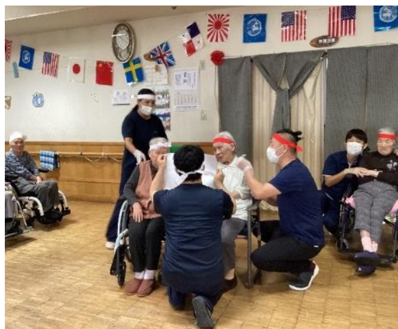
🚩 運動会 🚩