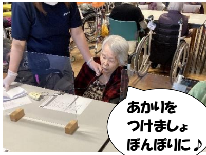
あかいをつけましょ ほんぼいに♪