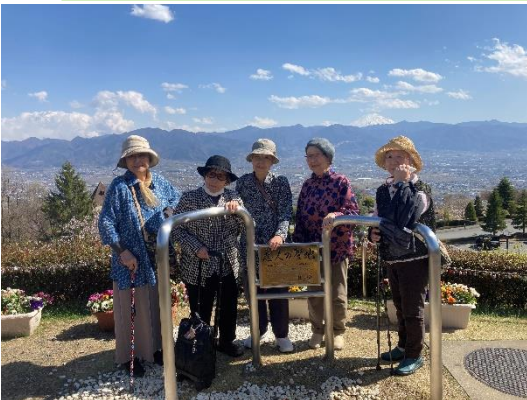
フルーツパークへ

春風に誘われる様に入居者様方からも、「どこかに出かけたね」「お花見出来るかな?」の声が多く聞かれる様になりました。職員間で話し合い「花も団子も楽しんで頂きたい」との思いから、山梨市のフルーツ公園に出かける事になりました。日程によっては桜も、桃も満開とはいきませんが、春めいた風を感じながら、皆様の良い笑顔を見ることが出来ました。