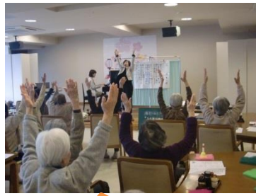
音楽に合わせて、からだ全体を使った体操や口腔体操

当日の参加者はケアハウス入居者様、デイサービス利用者様等を含め総勢40名程で、大盛況でした。