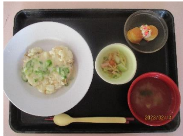
バレンタインデー