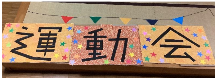
皆様と一緒に運動会の看板作りを行いました