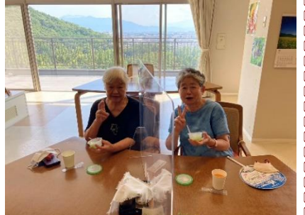
皆でアイス食べました