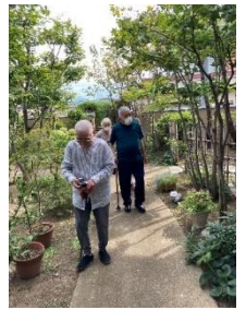
ご近所のカフェにて